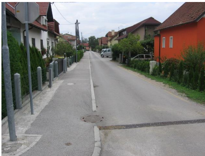
Fotografija št. 7: Vrtna ulica