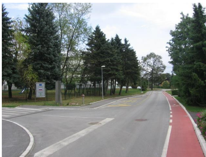
Fotografija št. 2: Avtobusno postajališče pred šolo