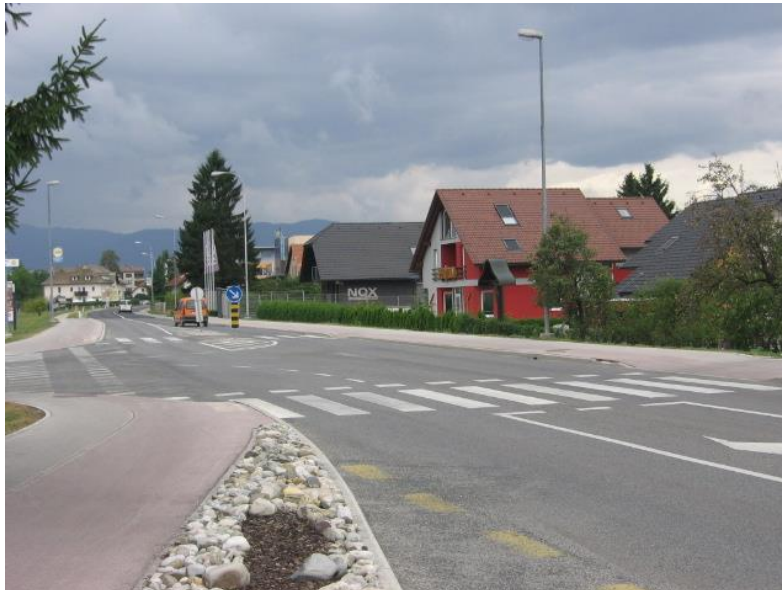
Fotografija št.10: Označen prehod za pešce z otokom na Rimski cesti