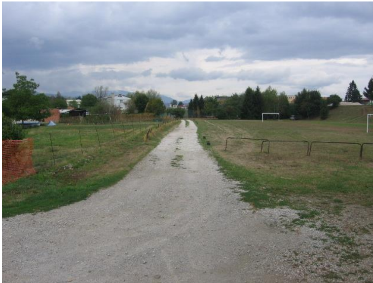
Fotografija št.9: Pešpot mimo športnega igrišča