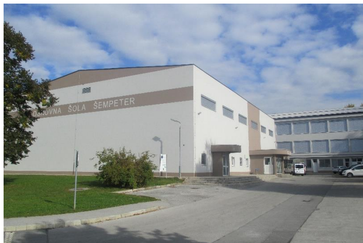
Fotografija št. 1: Parkirišče pred šolo