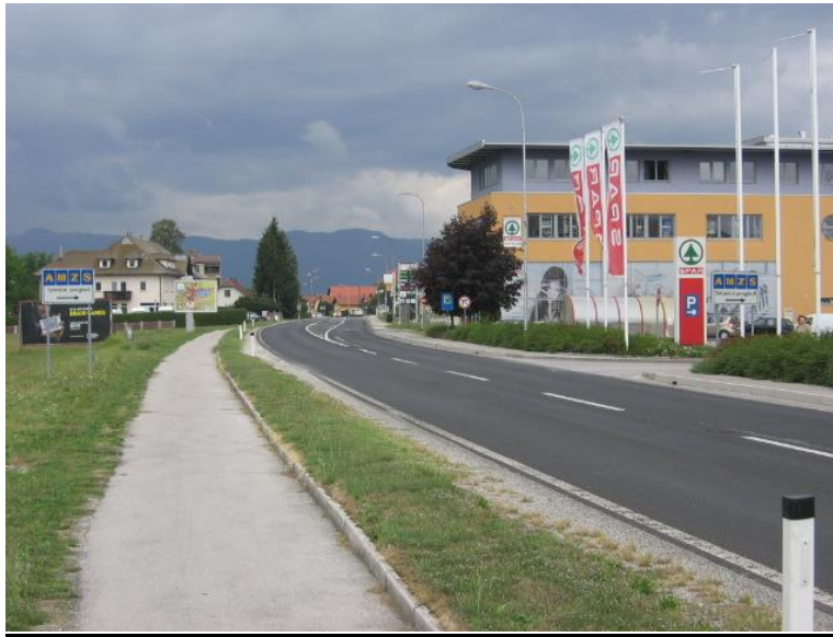
Fotografija št.13: Prometna površina namenjena pešcem ob Rimski cesti