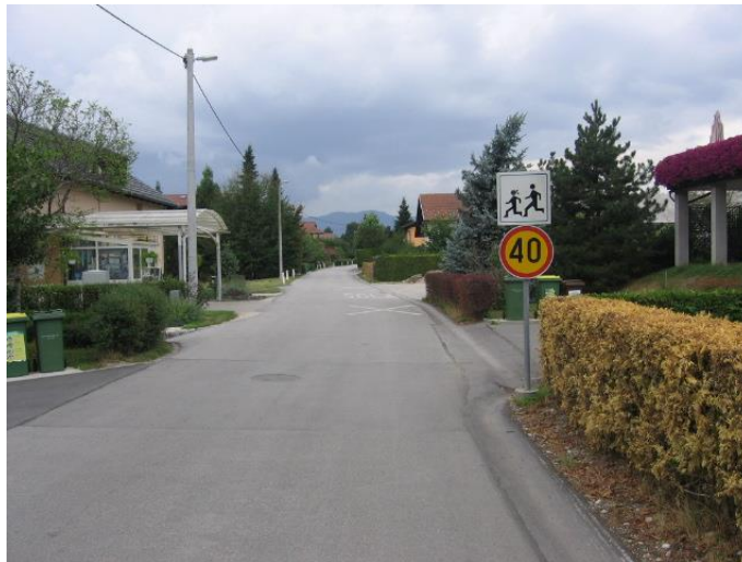
Fotografija št. 3: Savinjska ulica - ni pločnika