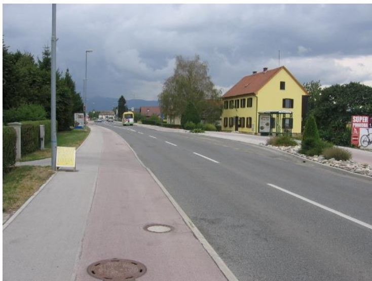
Fotografija št. 8: Rimska cesta