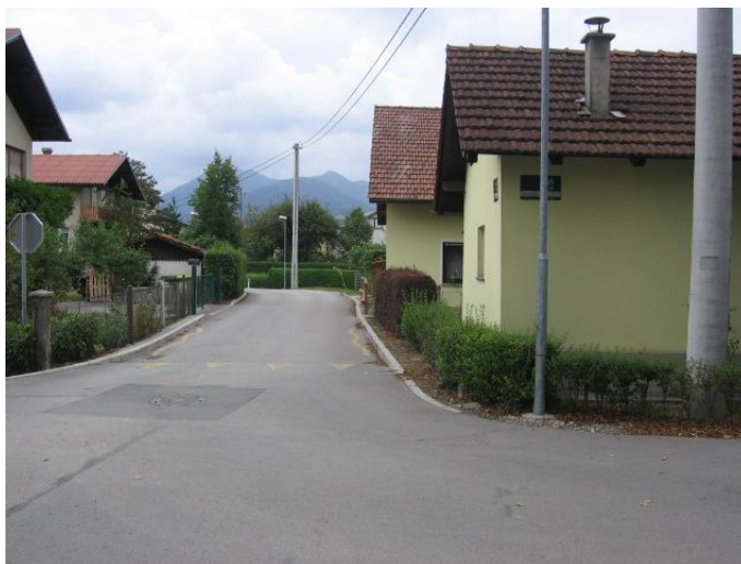
Fotografija št. 4: Križišče Hmeljarske ulice in Savinjske ulice – ni pločnika