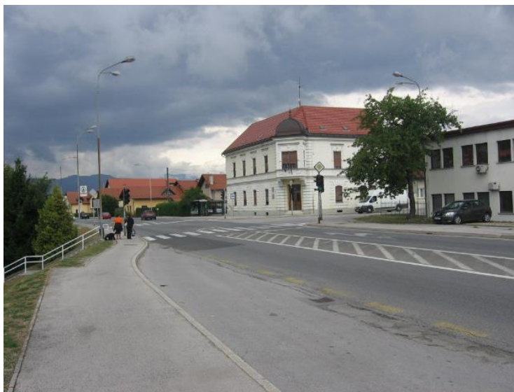
Fotografija št.11: Semaforizirano križišče na Rimski cesti (avtobusna postaja SIP-Šempeter)