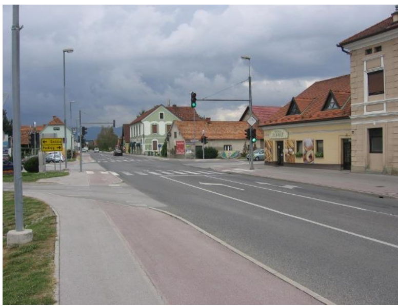
Fotografija št.12: Semaforizirano križišče na Rimski cesti (Petrov trg)