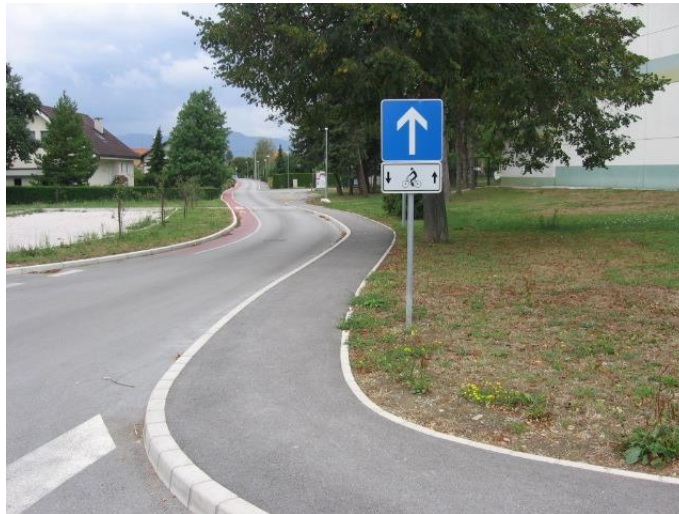
Fotografija št. 6: Šolska ulica