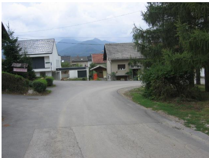
Fotografija št. 5: Križišče Savinjske ulice in Petelinjeka - ni pločnika in označenega prehoda za pešce